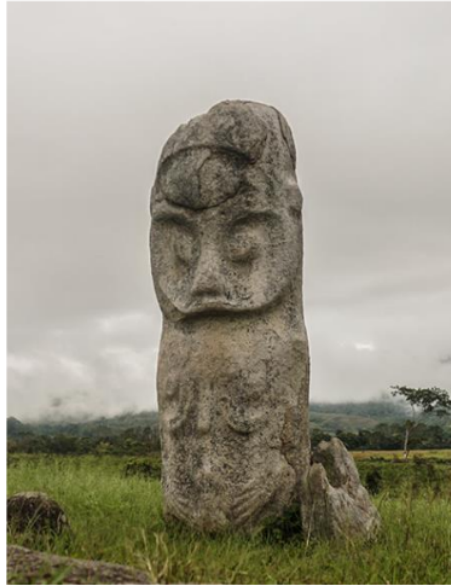
Gambar 3: Arca Tadulako yang menonjol Lembah Besoa

telah terjadi perluasan makna dengan mengakui pengaruh berbagai perubahan sosial dan budaya, yang terjadi karena dampak globalisasi dan inovasi teknologi di era modern (Nagy & Koles, 2014, p. 278).